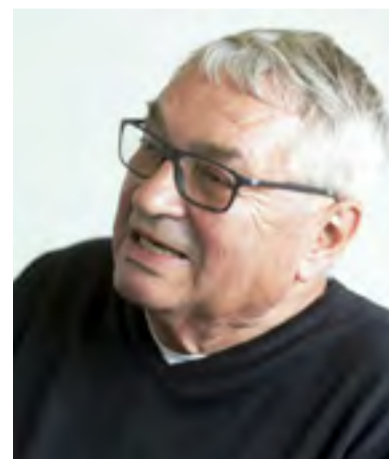
Heinz Bierbaum ist Präsident der Partei der Europäischen Linken

Sie hat nun eine Plattform mit dem Titel „Die Corona Krise und ihre Konsequenzen für die Europäische Politik“ vorgelegt. Ausgehend von der Feststellung des tiefgreifenden Charakters der Krise, die als eine systemische Krise interpretiert wird, werden Aktivitäten in fünf Bereichen gefordert. Zunächst geht es um einen umfassenden Schutz der Bevölkerung. Dies erfordert eine Stärkung des Gesundheitssystem auf europäischer Ebene. Konkret wird die Einrichtung eines Europäischen Gesundheitsfonds in Höhe von 100 Milliarden Euro gefordert, dessen Finanzierung über die EZB erfolgen soll. Einen zweiten Bereich stellt die Wirtschaft dar, auf den weiter unten eingegangen wird. Drittens warnt die EL davor, die Bekämpfung des Virus als Vorwand zum Abbau von Demokratie zu nehmen. Notwendige Beschränkungen müssen die Ausnahmen bleiben und dürfen nicht zum Dauerzustand werden. Viertens fordert die EL, die Coronakrise zum Anlass zu nehmen, um Abrüstung und Frieden in den Mittelpunkt der Politik zu stellen. Dabei sind insbesondere die Militärausgaben drastisch zugunsten