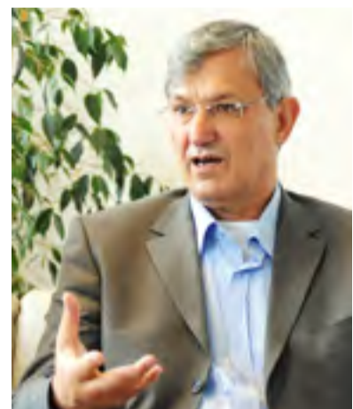
Bernd Riexinger ist einer der beiden Vorsitzenden der Partei DIE LINKE

Einmal mehr wird zudem die prekäre Situation der Leiharbeiter in der Industrie, der Werkvertrager, Mini-Jobberinnen und Solo-Selbständigen